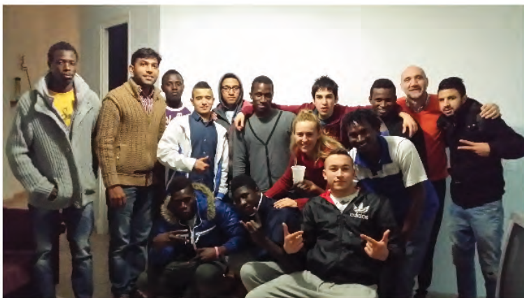
Jóvenes de los pisos de emancipación Magone- Valencia