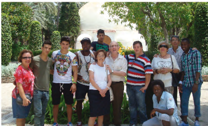
Familia de la Casa Mamá Margarita-Elche