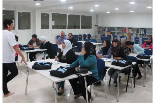
Programa Alraso en Cartagena