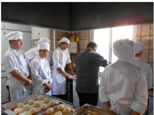
Inicio en nueva cocina Taller de Hostelería del Centro de Día Don Bosco-Valencia