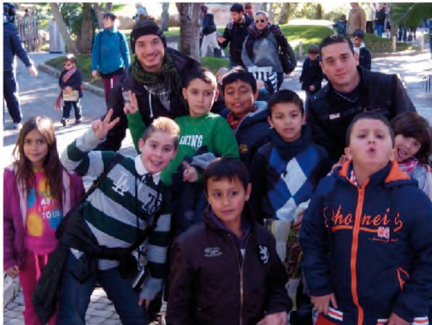
El Proyecto Apoyo Educativo Don Bosco Alcoy de visita en el Bioparc