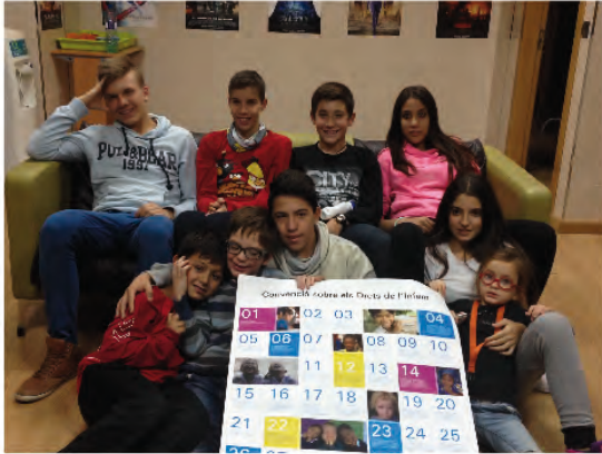
Casa Don Bosco Burriana. En el Día de los Derechos de la Infancia