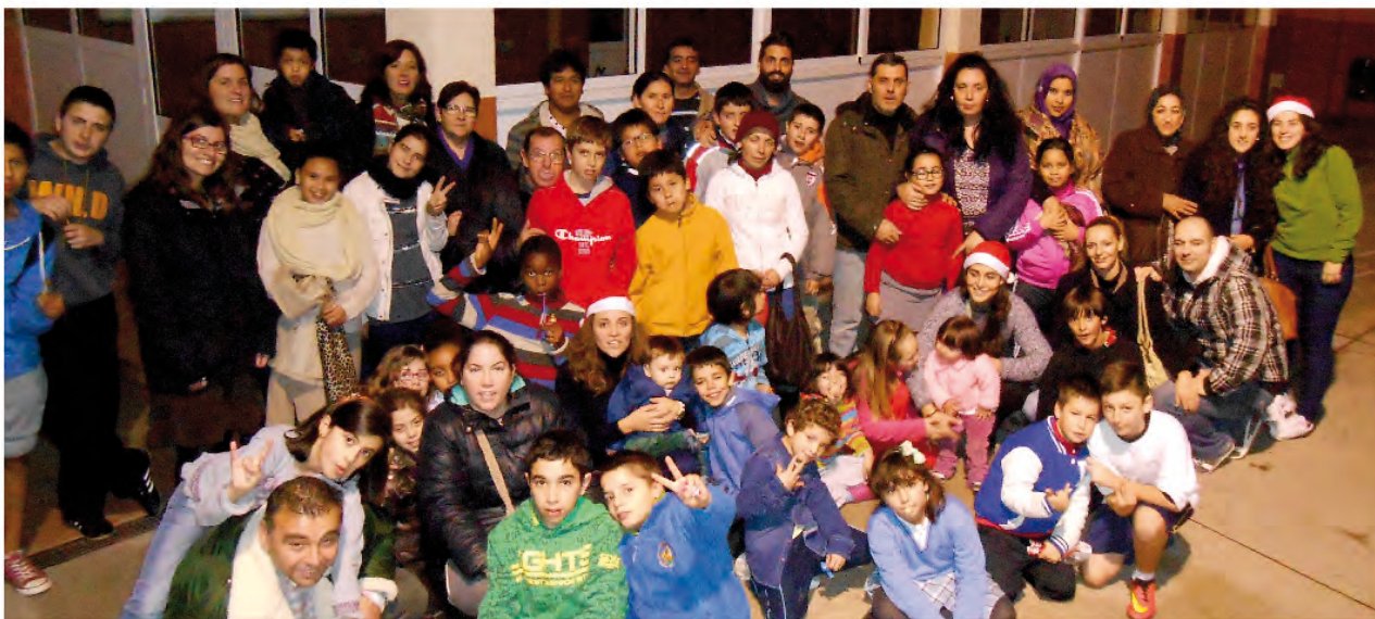
Crece la familia del Centro de Día Don Bosco-Valencia