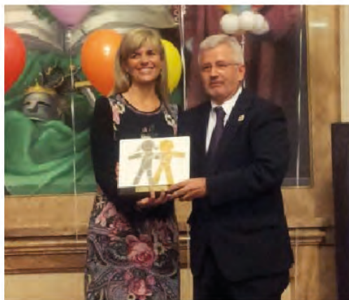
La Fundación recibe el premio Infancia de la Com. Val.