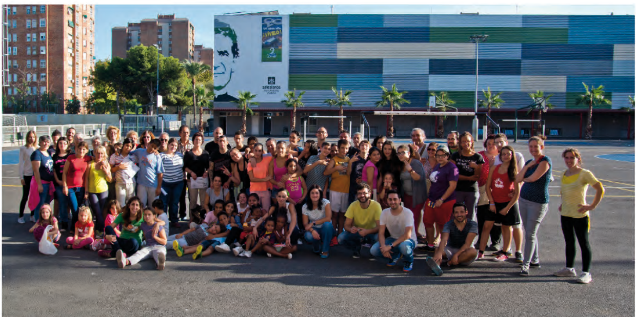
Familia del Centro de Día Entre Amics en Valencia