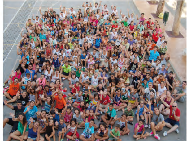
Familia del Campamento Urbano de Elche