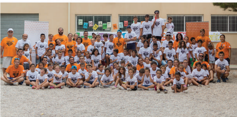
Campamento Urbano de Cartagena