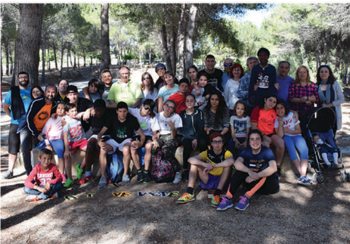
Día de la Casa Don Bosco de Valencia