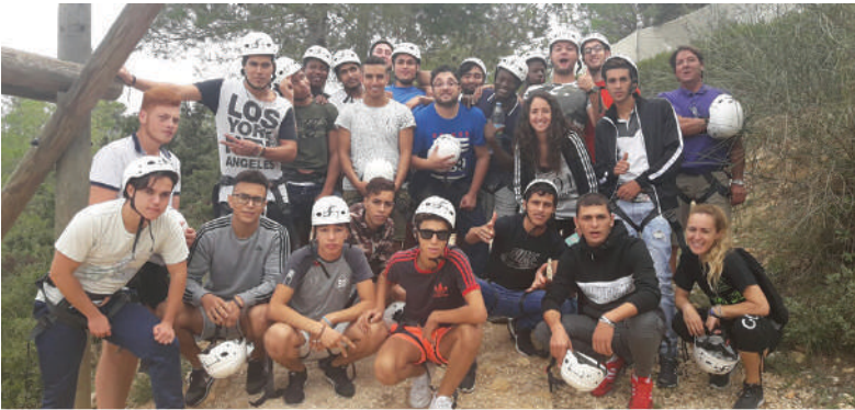
Salida conjunta de la jóvenes de los Pisos de Emancipación en Navalón