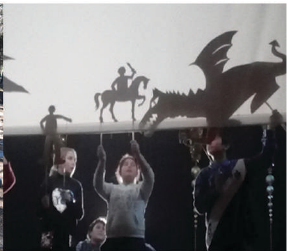
Proyecto de Apoyo Educativo Ángel Tomás de Villena. Participación en el Festival de Navidad del Colegio Salesianos