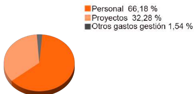
Distribución de los gastos 2017