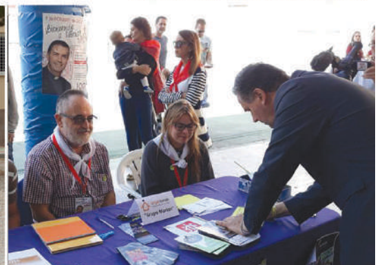
Grupo Martes en la Feria de las Plataformas Sociales con el Rector Mayor