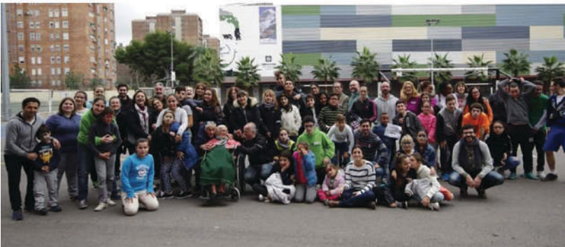
Día en Familia en el Centro de Día Entre Amics