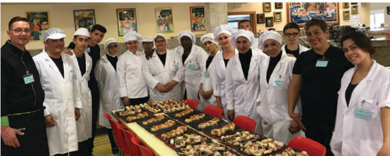
Curso de cocina del Programa de Inserción Laboral Alraso