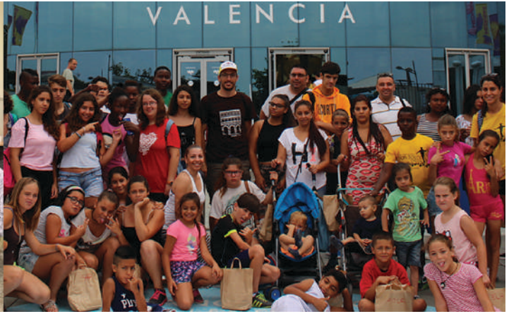
El centro de día Don Bosco visita el Oceanogràfic