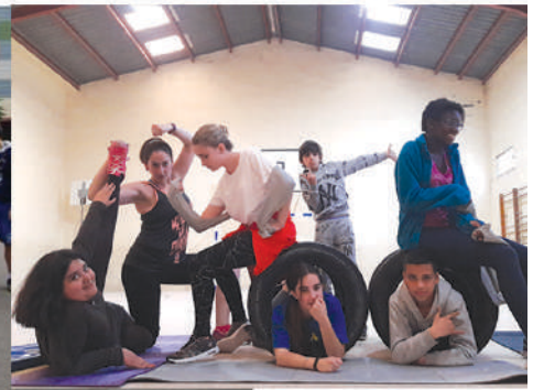
Jóvenes de la Casa Don Bosco de Burriana