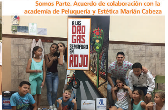
Proyecto de Apoyo Educativo Don Bosco Alcoy Taller de prevención de drogas