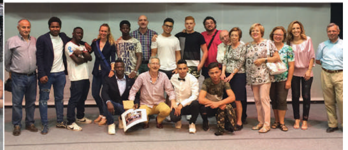
Graduación en ciclo medio mecanizado de los jóvenes de Casa Mamá Margarita