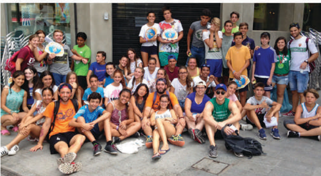
Campamento Urbano de Elche